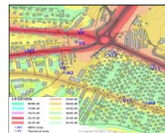
Hluková studie- výřez (Zlínský kraj)