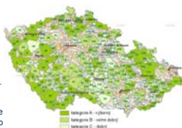
Území UAT, kategorie A, B, C